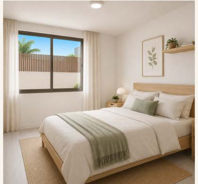
Dormitorio luminoso y soluciones de almacenaje integradas.